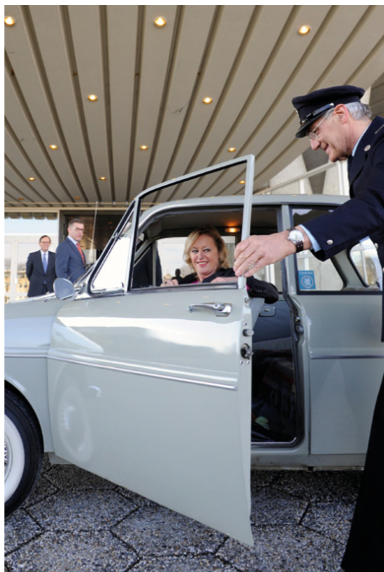
Behendig stuurde minister Bussemaker een authentiek Dafe 600 tot aan de voordeur van het Evoluon

E indhoven is een van de steden waar zich na de Tweede Wereldoorlog het wonder van de wederopbouw voltrok. Aangezwengeld door uitvindingen van Philips groeide hier de stedelijke economie in rap tempo, met het Evoluon als trots icoon. Een ideale plek dus voor de minister van Cultuur, dr. Jet Bussemaker, om een selectie van 89 nieuwe rijksmonumenten uit de periode 1959-1965 bekend te maken. Zij deed dit op 18 maart in aanwezigheid van de eigenaren van de bouwwerken, bestuurders en vertegenwoordigers van gemeenten en erfgoedorganisaties. 'Als stille getuigen houden deze rijksmonumenten de herinneringen aan de Nederlandse geschiedenis levend en zorgen ze ervoor dat die verhalen worden doorverteld en herverteld door vele generaties na ons', zo sprak de minister. Op de bijeenkomst vroeg zij aan de Raad voor Cultuur over dit selectievoorstel advies uit te brengen.