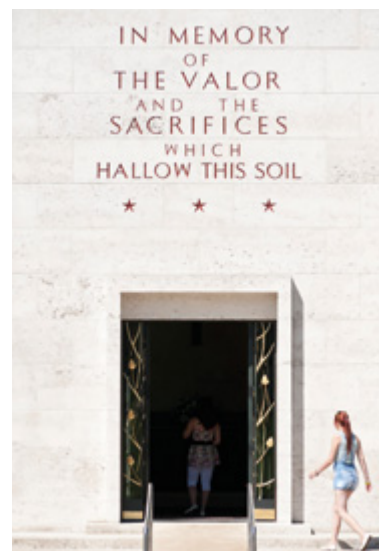
De Amerikaanse begraafplaats in Margraten