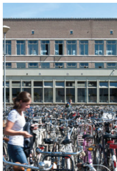
Voorgedragen: het Sint-Janslyceum in Den Bosch

Tussen 1959 en 1965 zijn er in Nederland 2,5 miljoen nieuwe bouwwerken opgetrokken. Na een strenge selectie maken 89 daarvan nu kans om beschermd te worden als rijksmonument. 'Als stille getuigen houden deze monumenten de herinneringen aan de Nederlandse geschiedenis levend.' BEN DE VRIES